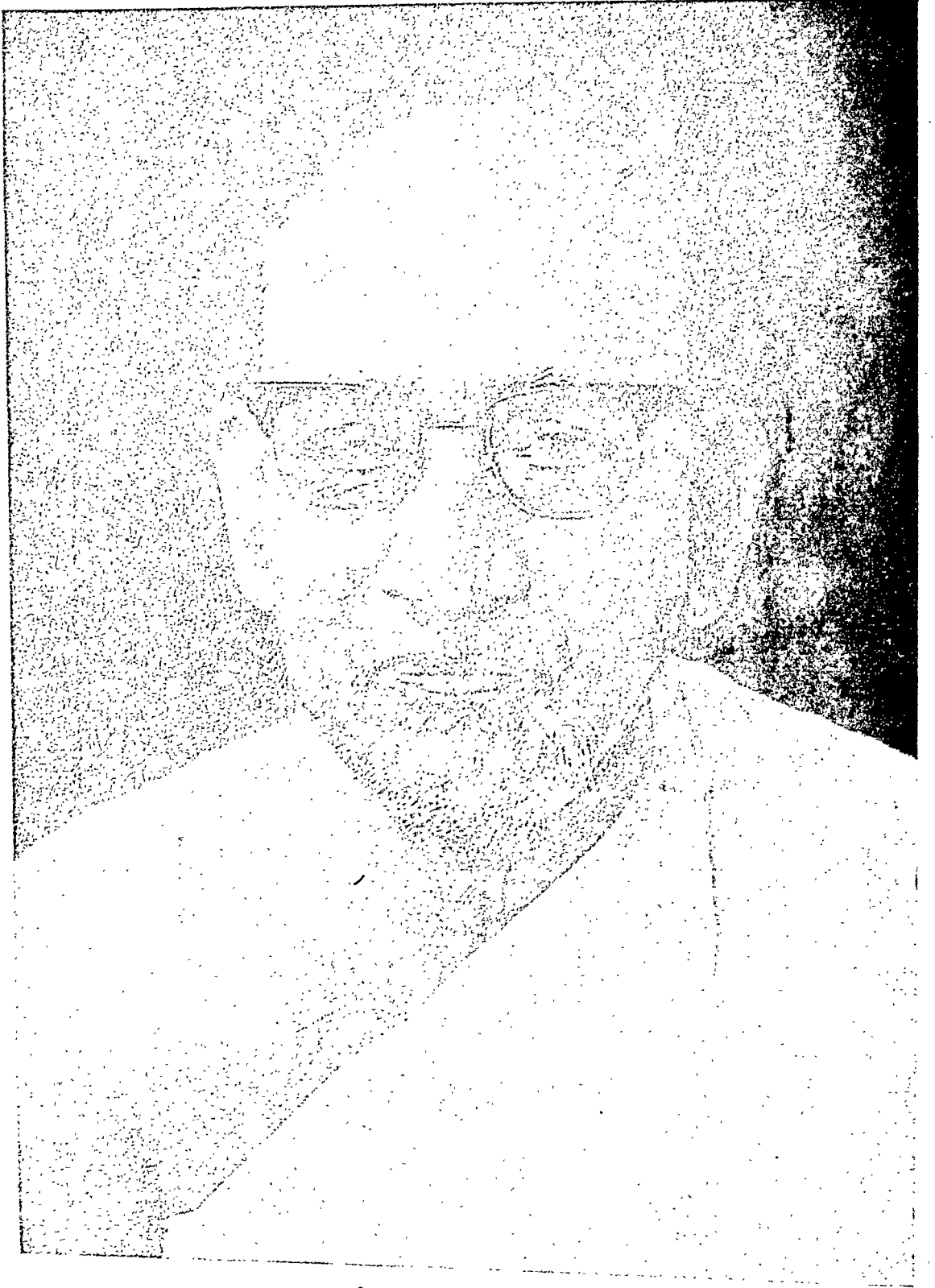
विद्वद्भ्यं मुनि श्री पुण्यनिजयजी (आयमदभाकश्री)